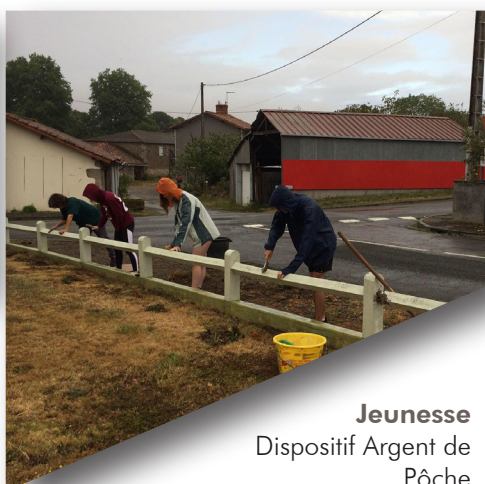
Jeunesse Dispositif Argent de Pêche