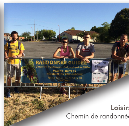
Loisirs Chemin de randonnée