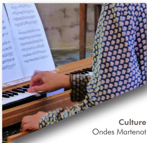
Culture Ondes Martenot

Présentation des élus et de leurs délégations