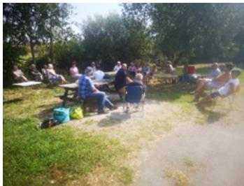
Assemblée générale du 11-09-2020