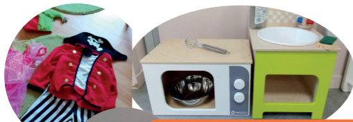
Espace jeux d'imitation/ jeux de rôle