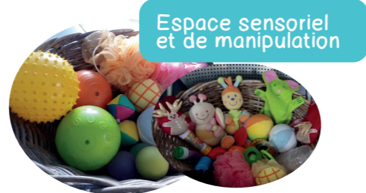
Espace sensoriel et de manipulation