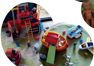
Espace mise en scène