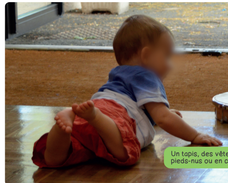
Un tapis, des vêtements souples, pieds-nus ou en chaussettes et c'est parti !

Prenez le temps de vous poser, d'observer cet enfant, voyez son habileté, ses stratégies, son inventivité... Plus vous l'observerez et plus la liberté de se mouvoir librement au sol fera sens pour vous.