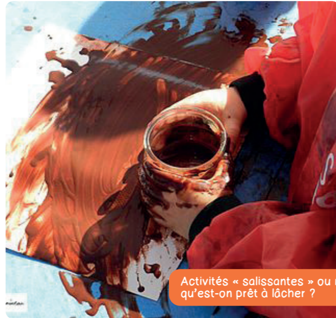
Activités « salissantes » ou non, qu'est-on prêt à lâcher ?

Je suis assistant maternel : Je préfère proposer des ateliers qui ne « saliront » pas les enfants et ma maison. Je propose énormément d'ateliers autour de la motricité, contes, comptines et promenades. Je reconnais préférer faire